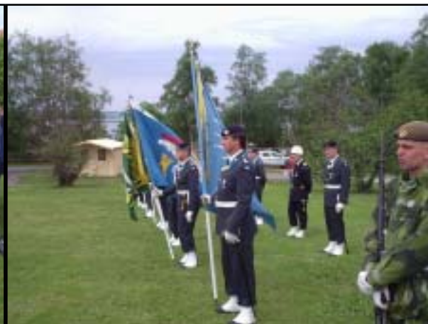
Förenings- och föbandsfanorna fanns på plats i samband med ceremonin