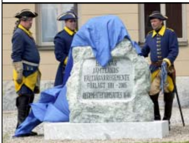
En speciell ceremoni genomfördes i samband med att minnesstenen avtäcktes.