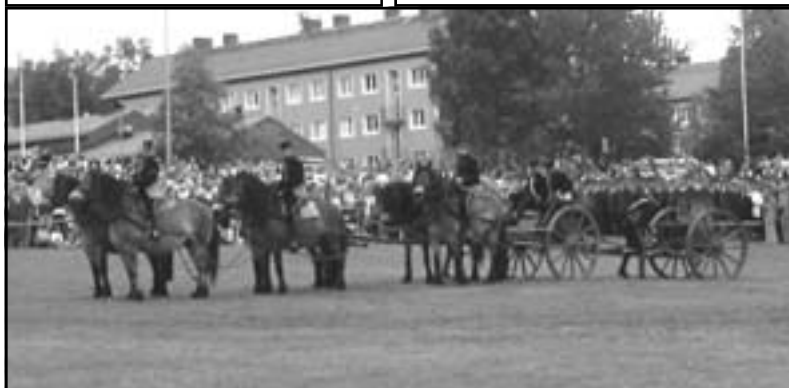
Hästdraget artilleri förevisades