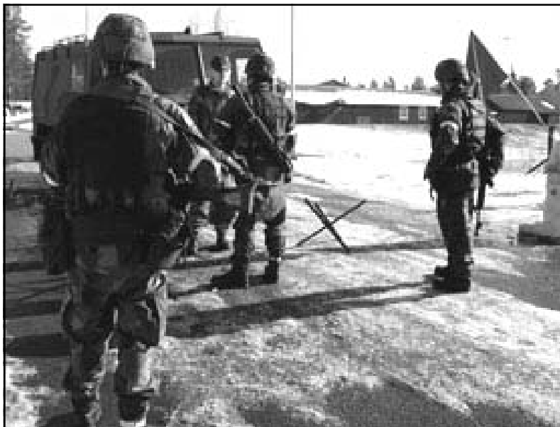
Infartsposterna stoppar en obehörig i gaten till underhållskompaniet.

Vid lunchtid, på måndagen den 7 mars, startade ASÖ