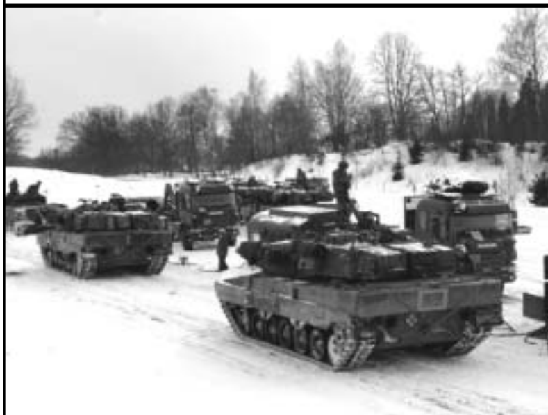
Toloplutonen genomför en bataljons tolo på P 4:s övningsfält