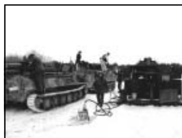
Tankning av PBV 401 och PBV 302.