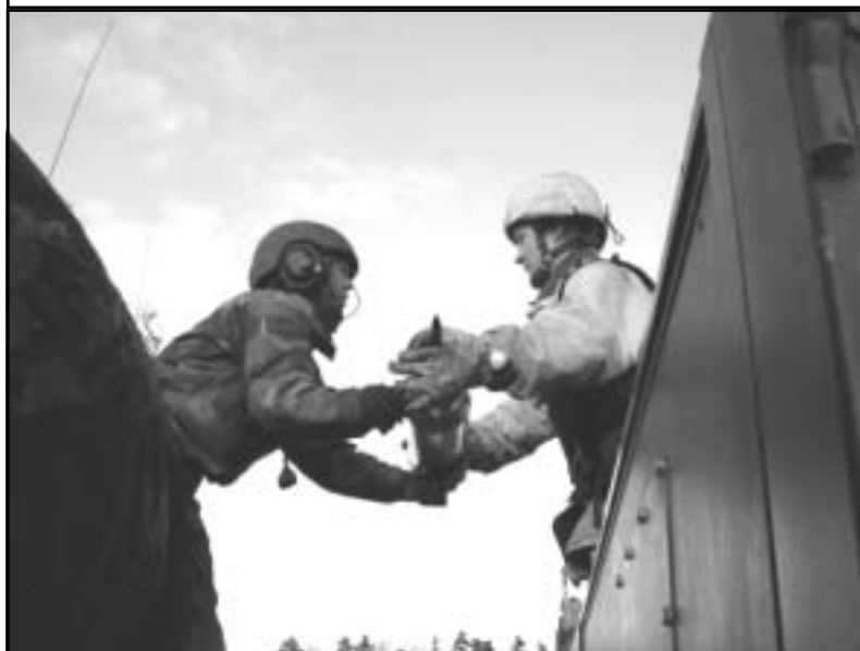
Överlämning av ammunition