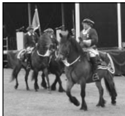
Under den historiska återblicken parader denna trio ryttare förbi.