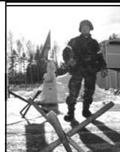
Bergenstråle bevakar kompaniets infart.